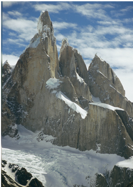
Cerro Torre (Camp de Gel Patagònic Sud Argentina)